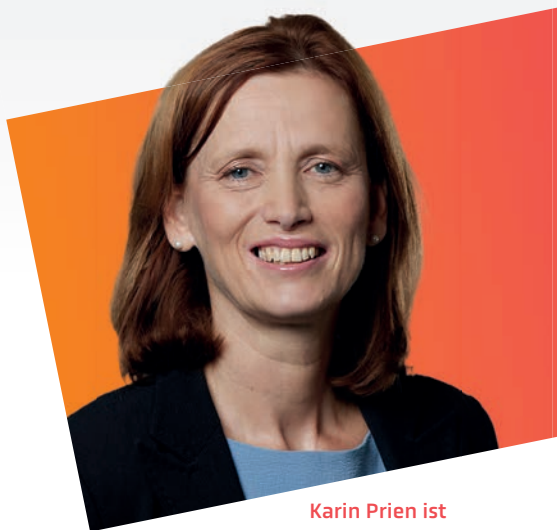
Karin Prien ist Bundesministerin für Bildung, Familie, Senioren, Frauen und Jugend.

Ich wünsche allen Schülerinnen, die in diesem Jahr teilnehmen, spannende Erkenntnisse und vor allem eines: Viel Spaß!