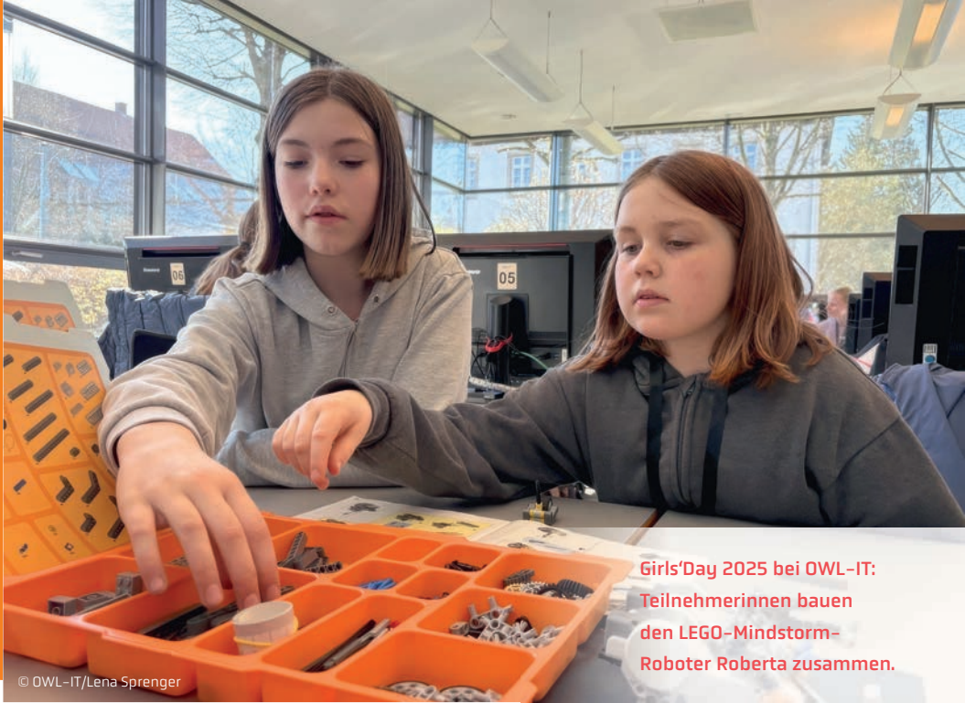
Girls'Day 2025 bei OWL-IT: Teilnehmerinnen bauen den LEGO-Mindstorm- Roboter Roberta zusammen.